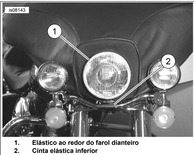
Figura 2. Orientação adequada do suporte da carenagem (aro do farol dianteiro não instalado)