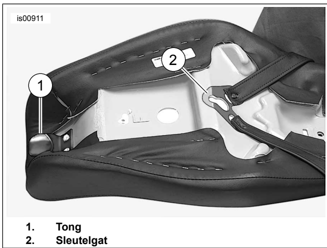
Afbeelding 2. Onderkant van tweepersoonszadel