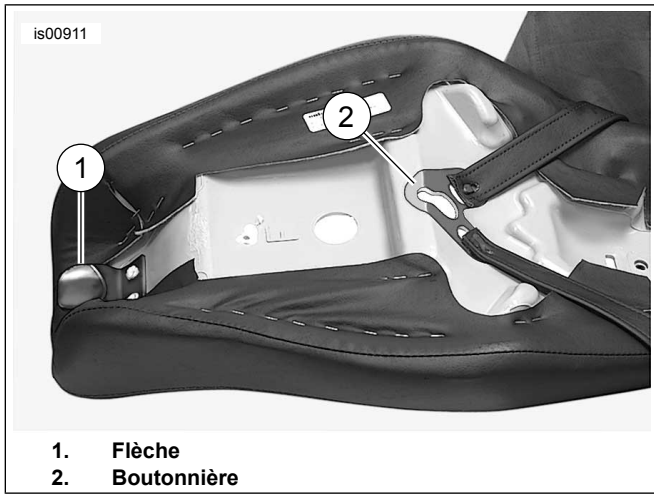
Figure 2. Dessous de siège à 2 personnes