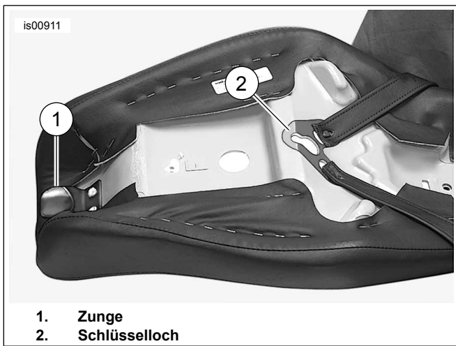
Abbildung 2. Unterseite des Soziussitzes