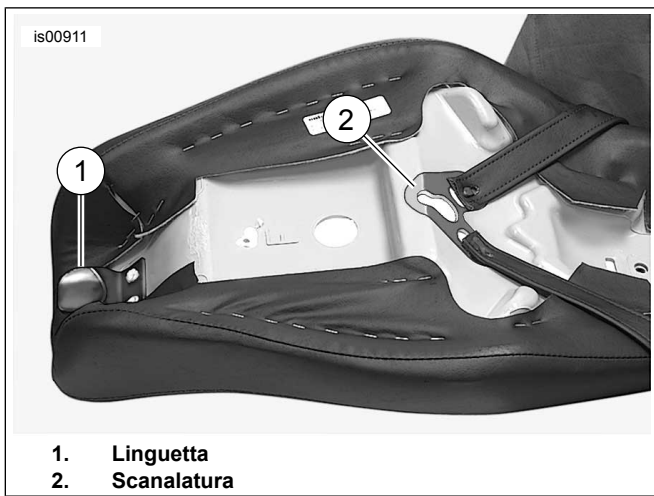
Figura 2. Lato inferiore della sella "2-up"