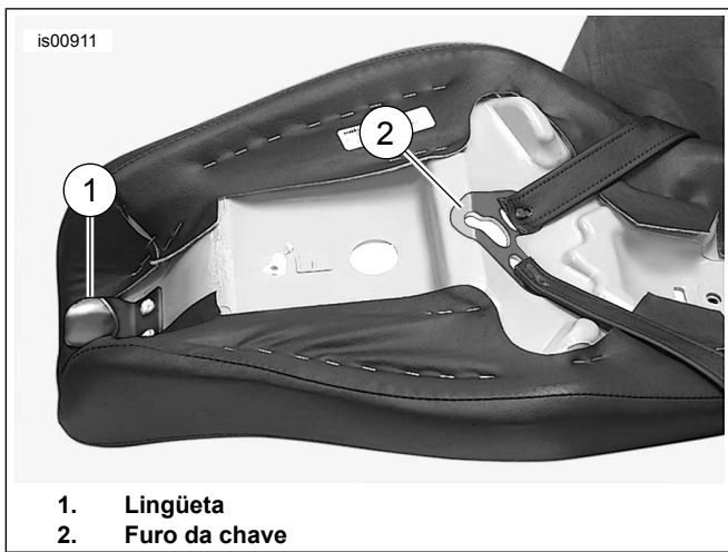
Figura 2. Parte inferior do assento tipo 2-up