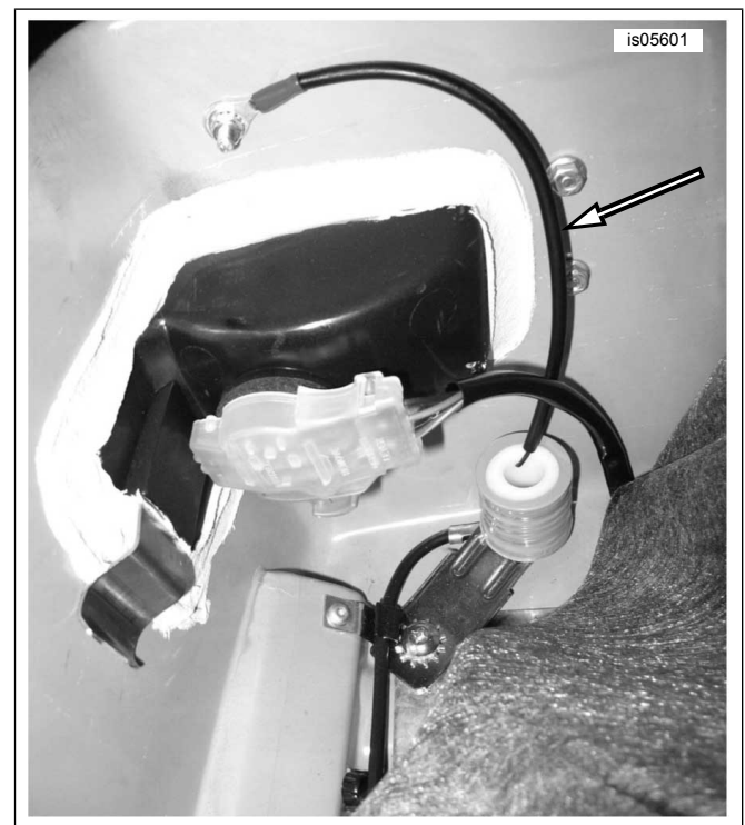
Figure 2. Acheminement du câblage de la bobine de charge du signal CB