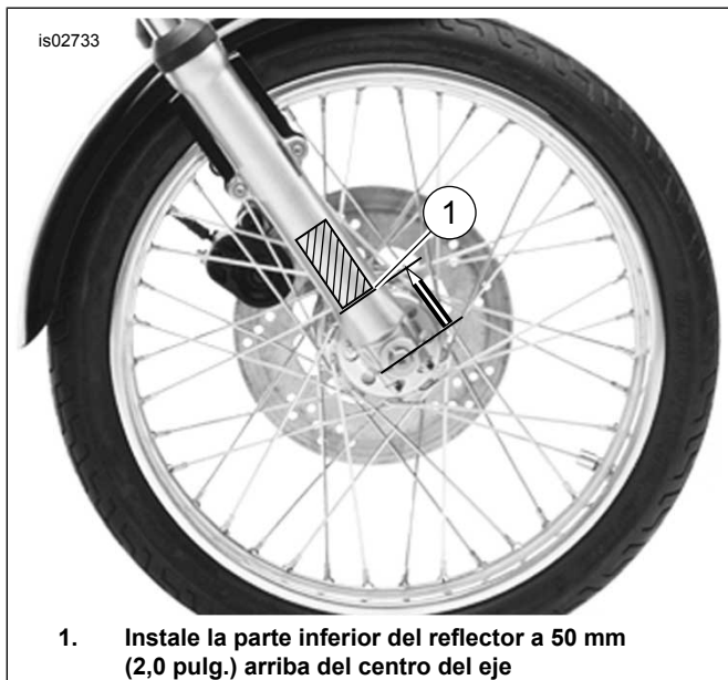
1. Instale la parte inferior del reflector a 50 mm (2,0 pulg.) arriba del centro del eje