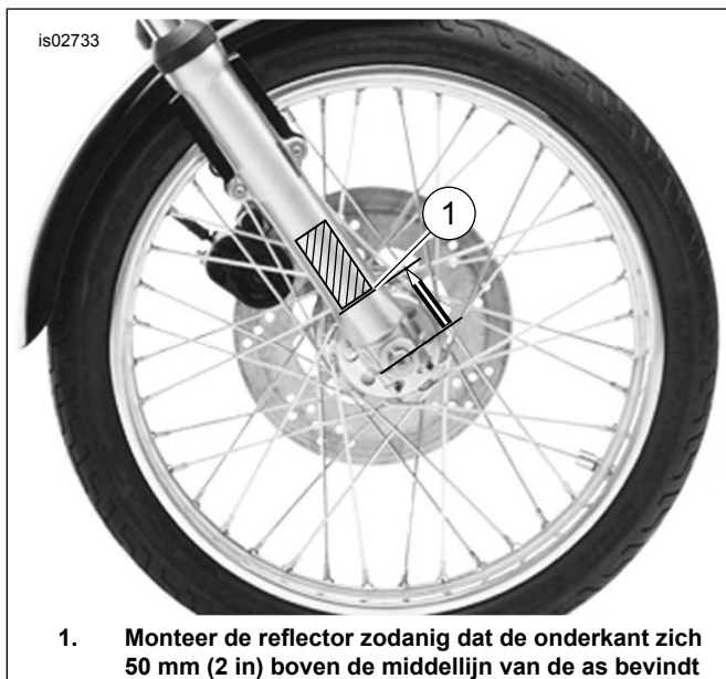
Afbeelding 1. Plaatsen van de reflector

De aan beide zijden van de onderste voorvorkpoten aanwezige voorste reflectoren worden verwijderd, schoongemaakt en op de nieuwe, glanzend zwarte, onderste voorvorkpoten gemonteerd.