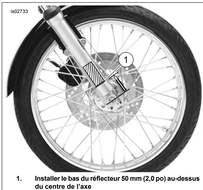
Figure 1. Emplacement du réflecteur

Les réflecteurs avant situés des deux côtés des fourreaux de fourche remplacés seront retirés, nettoyés et installés sur les nouveaux fourreaux de fourche noir lustré.