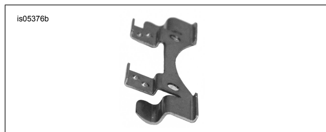
Figura 1. Presilha de montagem da dobradiça