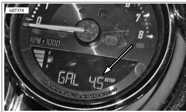
图6. 选择燃油箱尺寸(仅限运动者车型)