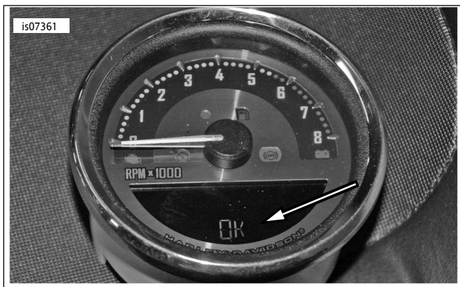
图3。显示“OK”（完成）的速度表