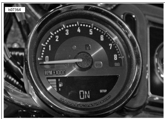
图5. 燃油油位显示设置