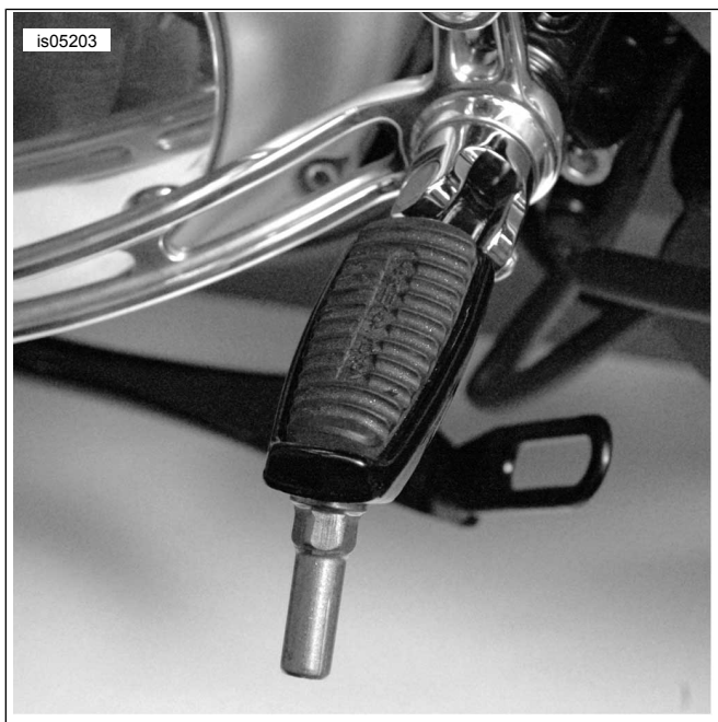
Figura 2. Instalación correcta (taco apoyapiés y punta contra desgaste genéricos)