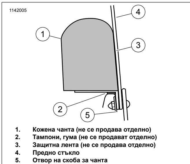
Фигура 2. Прикрепяне на щипка за обтекател, страничен изглед