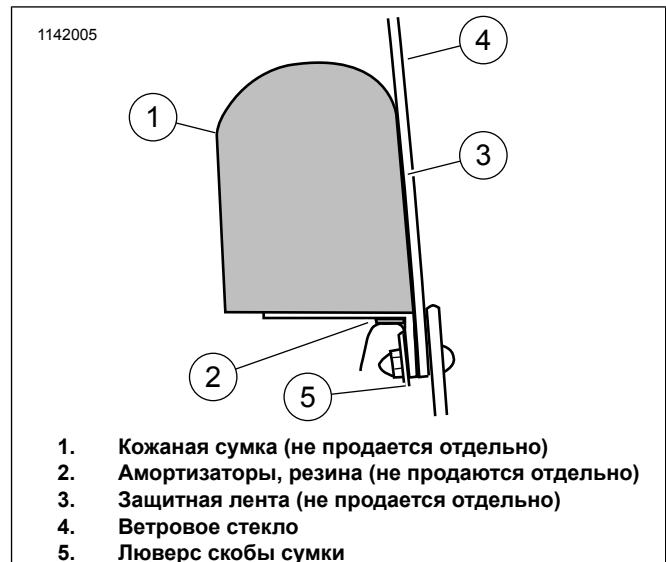
Рисунок 2. Крепление зажима обтекателя, вид сбоку