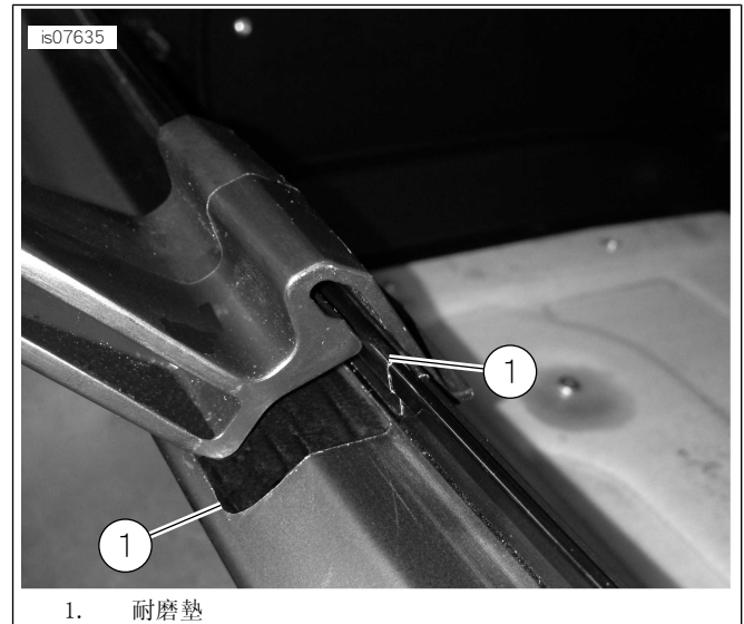
圖1。將耐磨墊安裝在Tour-Pak