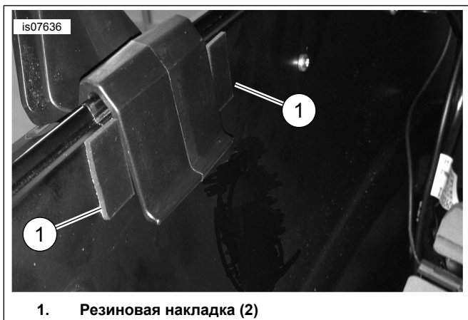
Рисунок 2. Установка резиновых накладок с внутренней стороны заднего кофра Tour-Pak