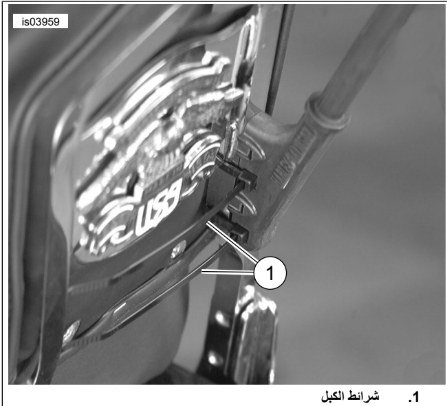
الشكل 2. منظر داخلي لسارية العلم المثبتة