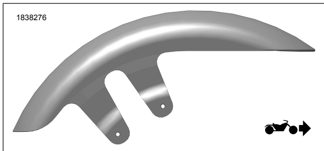
Figure 2. Orientation du garde-boue