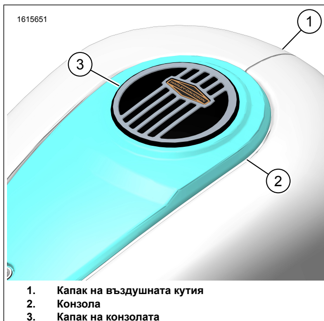
Фигура 2. Декорацията на конзолата е монтирана