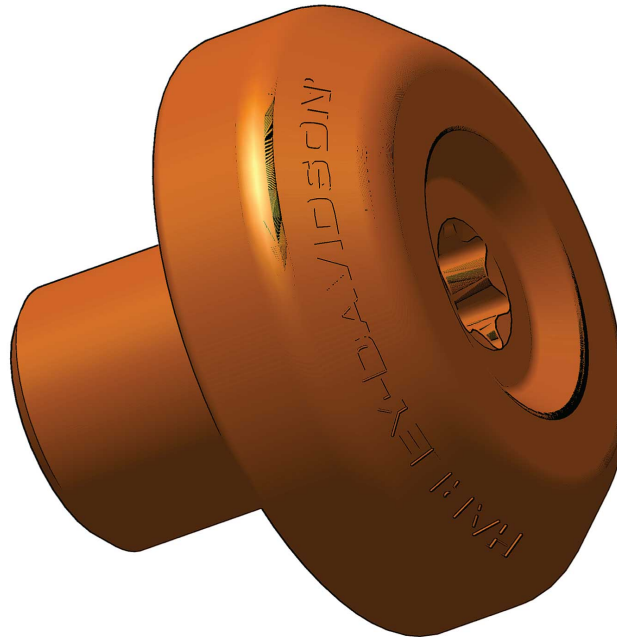
Gambar 1. Isi Kit: Tutup Ujung Gagang Setang