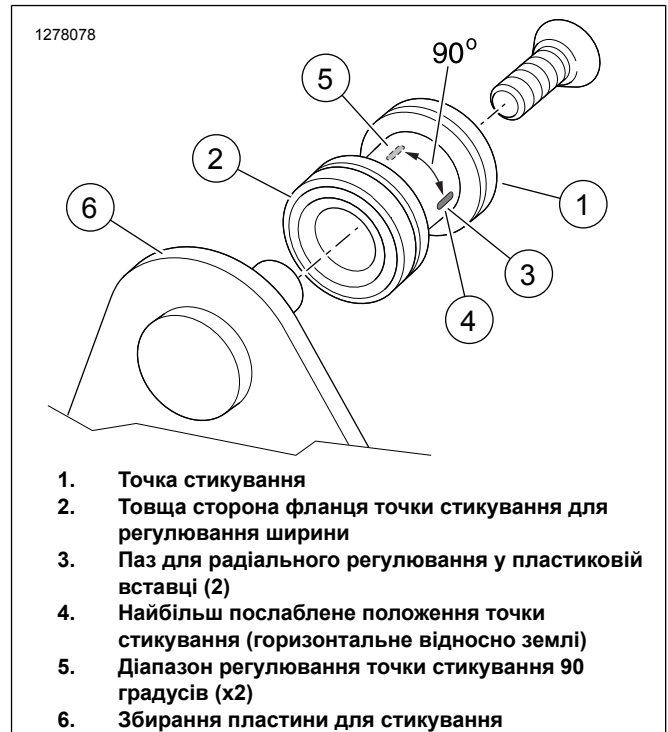
Малюнок 2. Встановлення точки стикування